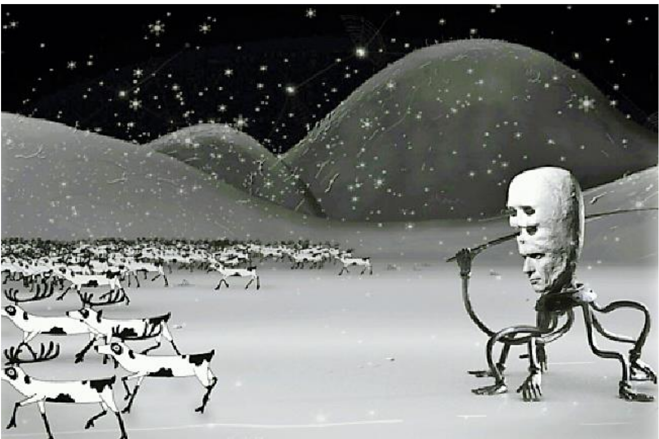
Journey to the Maggot Feeder